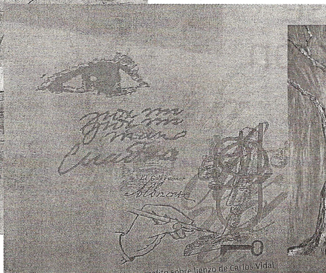
"Las palabras de un día". Óleo y grafito sobre lienzo de Carlos Vidal