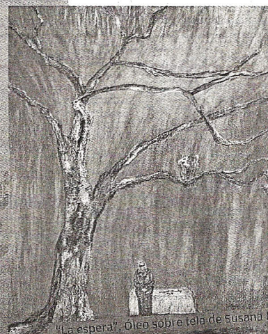
"La espera". Óleo sobre tela de Susana Hubert